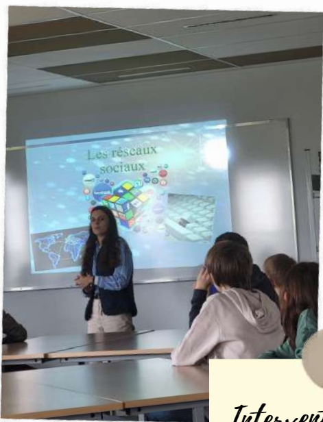
Intervention sur les réseaux sociaux