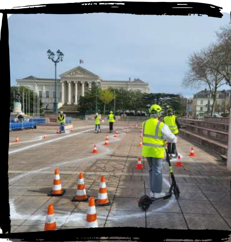
Atelier pratique avec des trottinettes électriques