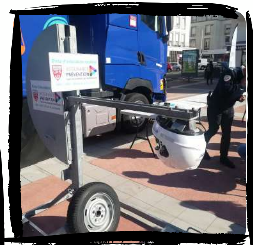
Simuler l'effet sur un casque d'un choc