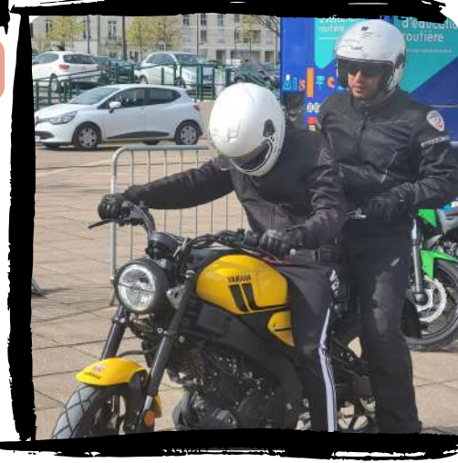
Conduite en « double commande » avec un moniteur