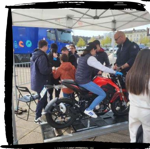
La phase pratique sur un "home trainer" (moto fixe)