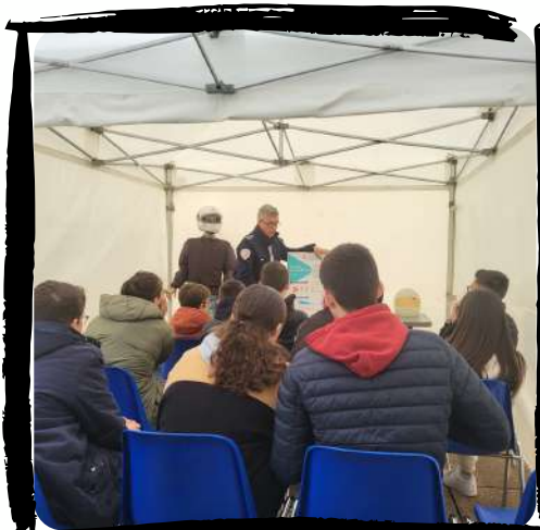
Rappel du code de la route