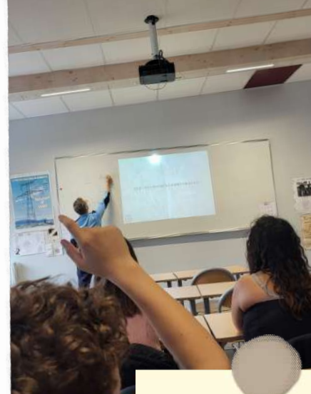
Intervention sur la responsabilité pénale et drogues